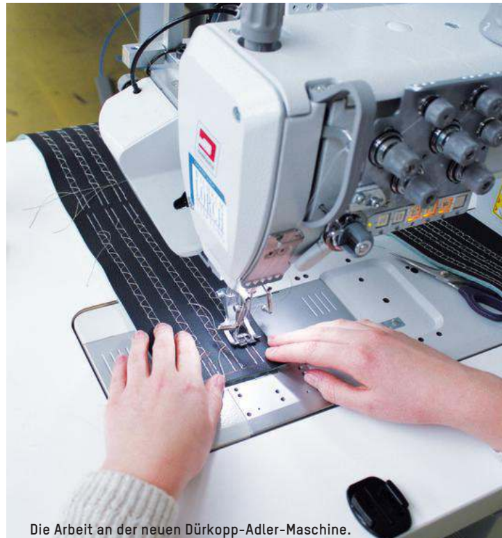
Die Arbeit an der neuen Dürkopp-Adler-Maschine.